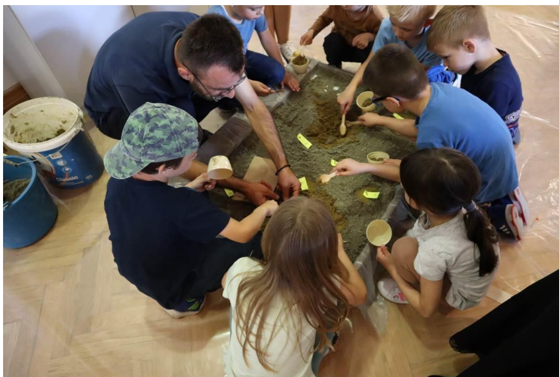
8. Radionica Mali arheolog