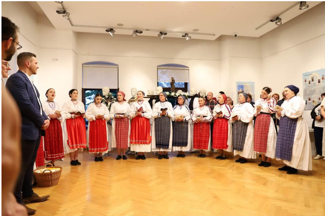
9. Nastup HKUD-a Dika na otvaranju izložbe: Kad cvatu bijeli ljiljani - pučka pobožnost sv. Antunu Padovanskom u našičkom i slatinskom prostoru