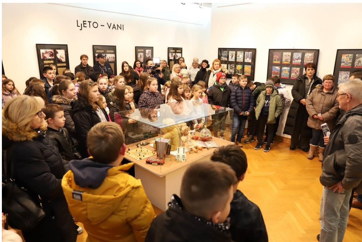
1. Posjetitelji na otvaranju manifestacije Noć muzeja