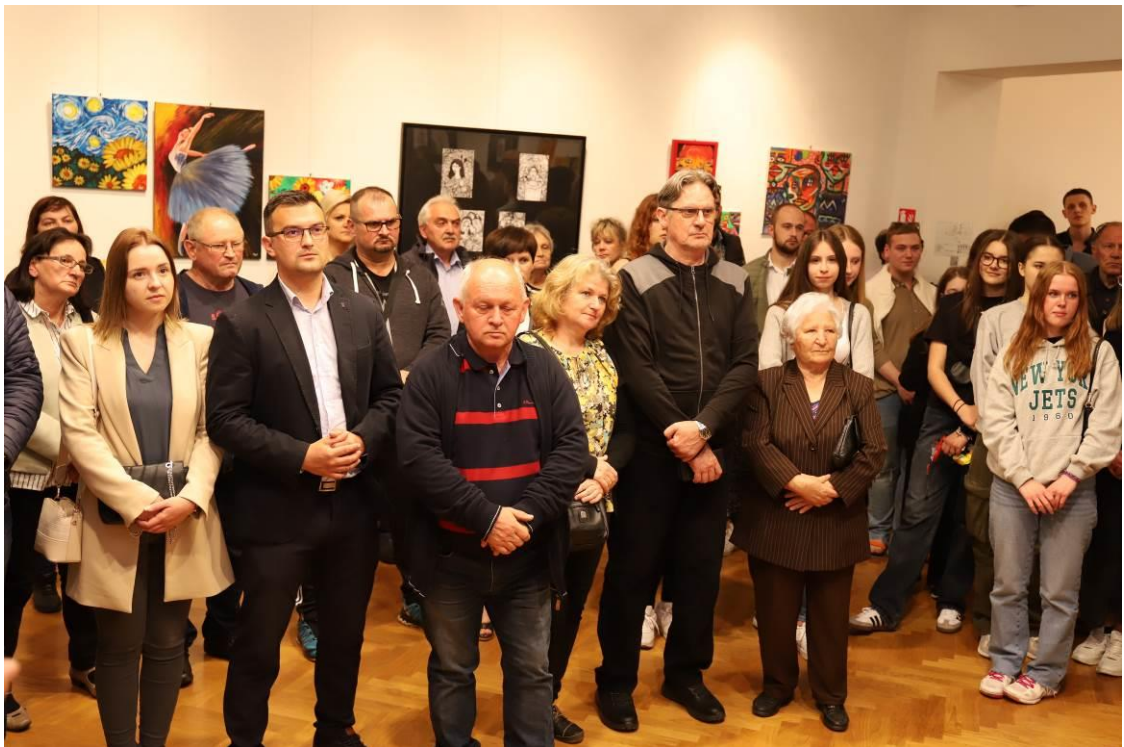
6. Otvaranje izložbe mladih umjetnika u suradnji s Udrugom KRIK