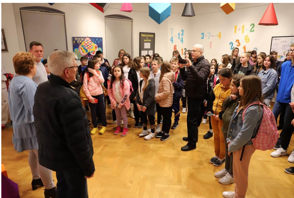
4. Otvaranje izložbe Matematika i mi