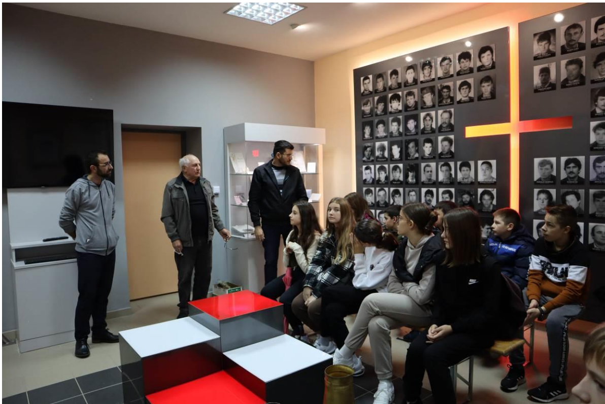
12. Posjet polaznika programa Istina o pobjednicima spomen sobi Domovinskog rata