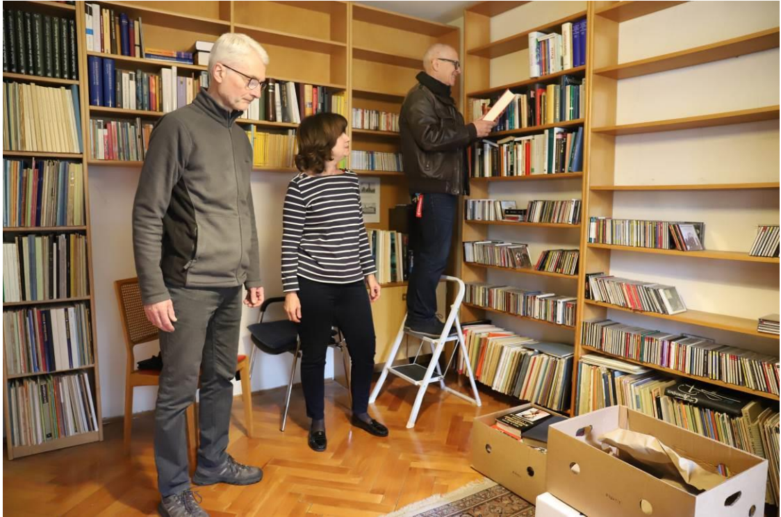
5. Preuzimanje donacije Žmegač