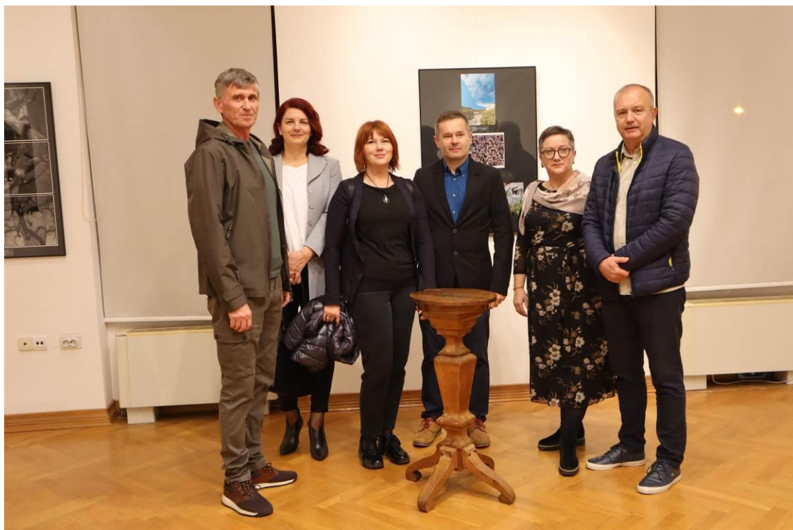
13. Otvaranje izložbe Šuma okom šumara