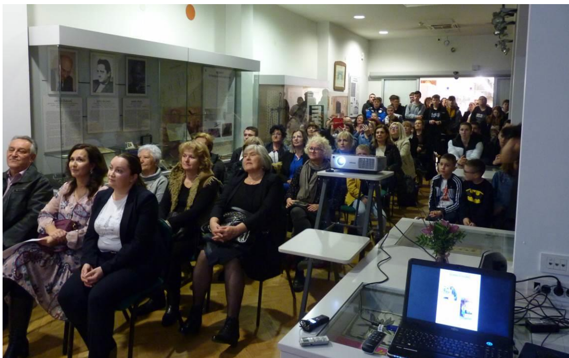
3. Posjetitelji na predavljanju digitalne izložbe Slatinčanke