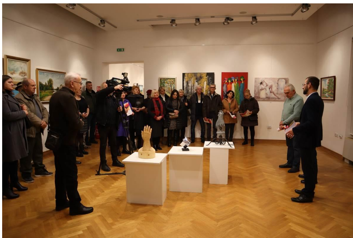
14. Otvaranje Godišnje izložbe slatinskog likovnog kluba