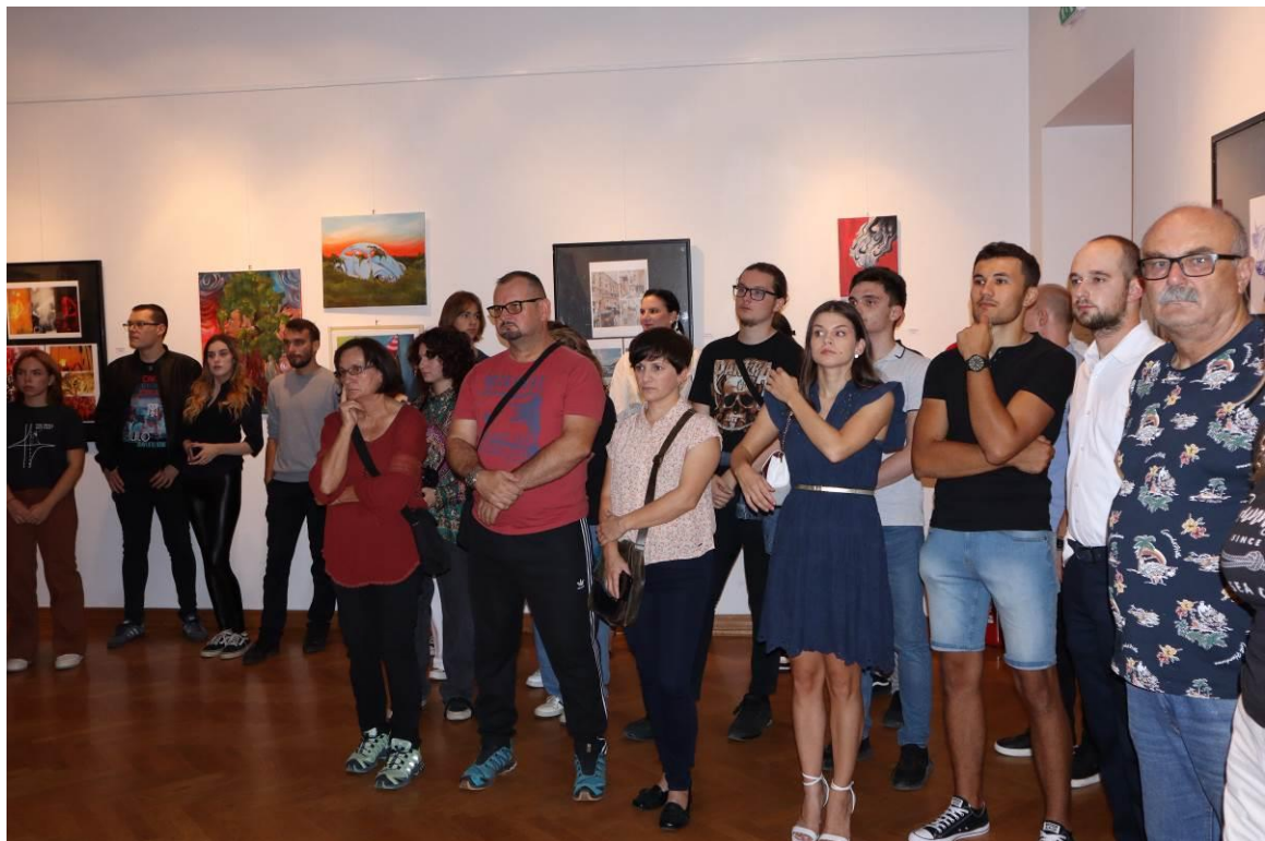
10. Posjetitelji na otvaranju izložbe Udruge KRIK