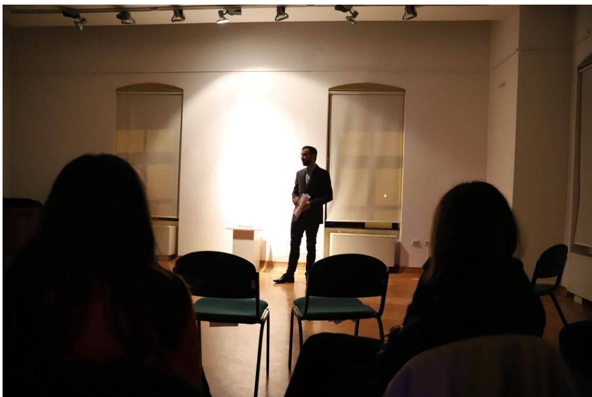
2. Muzejske tajne