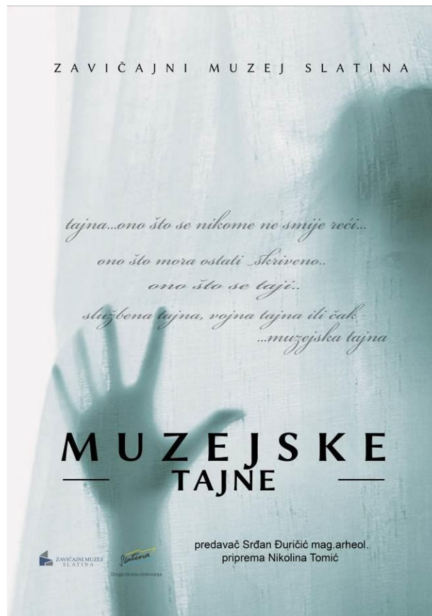
2. Muzejske tajne