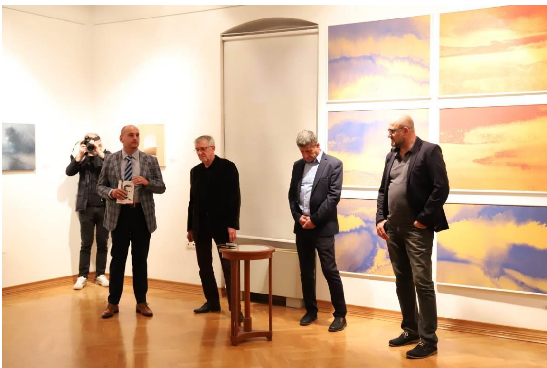
15. Otvaranje izložbe „Slikarstvo A U K!“