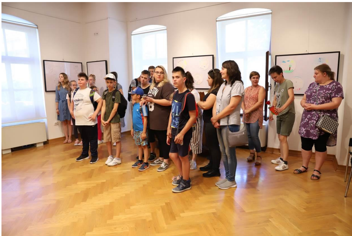
11. Izložba Pokreni promjenu