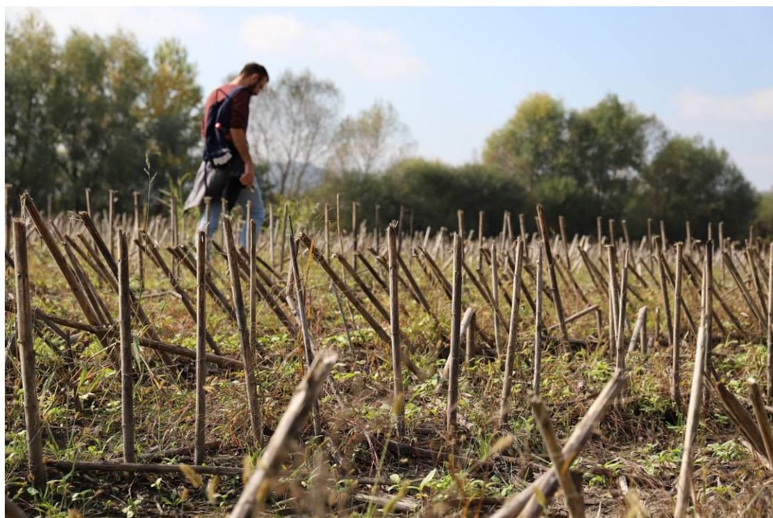
16. Terenski pregled