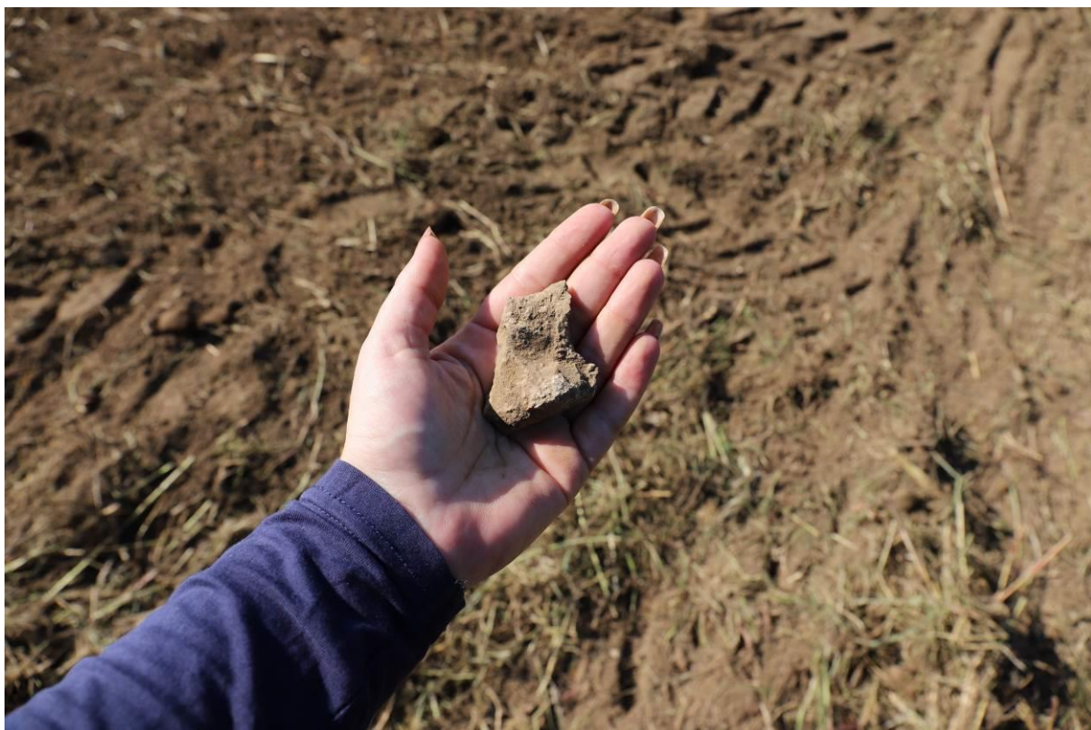
17. Obilazak lokaliteta