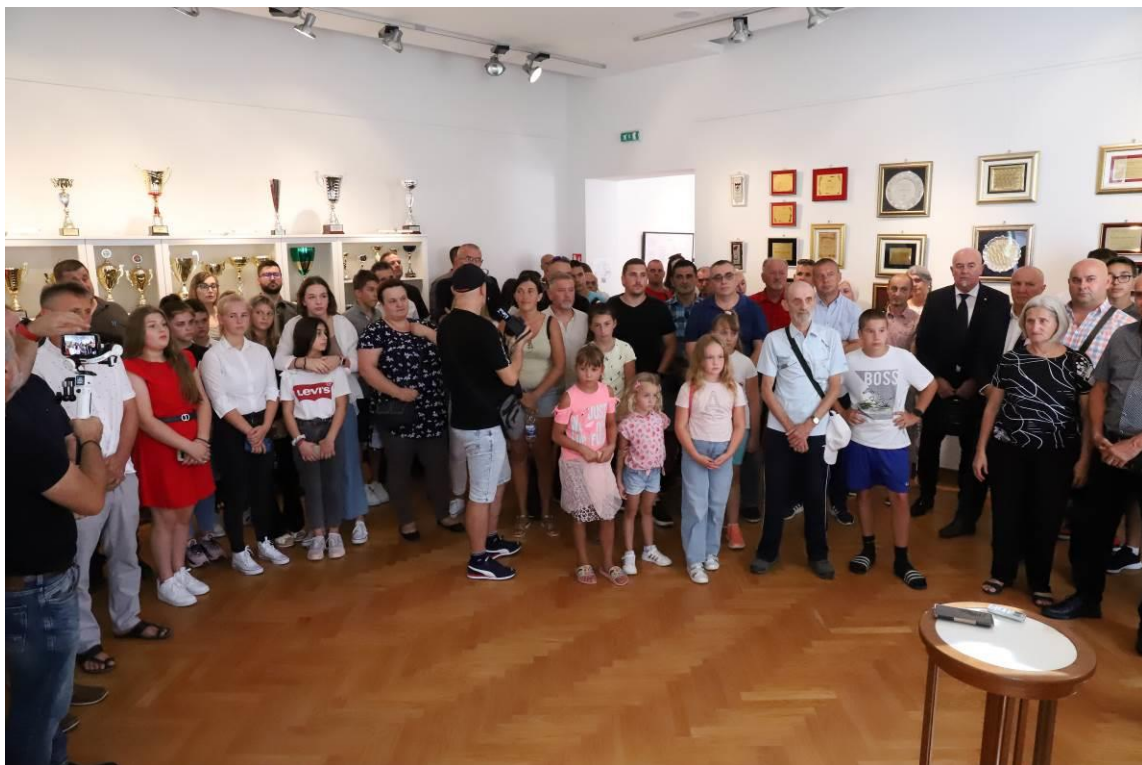
10. 50.godina hrvackog kluba Slatina