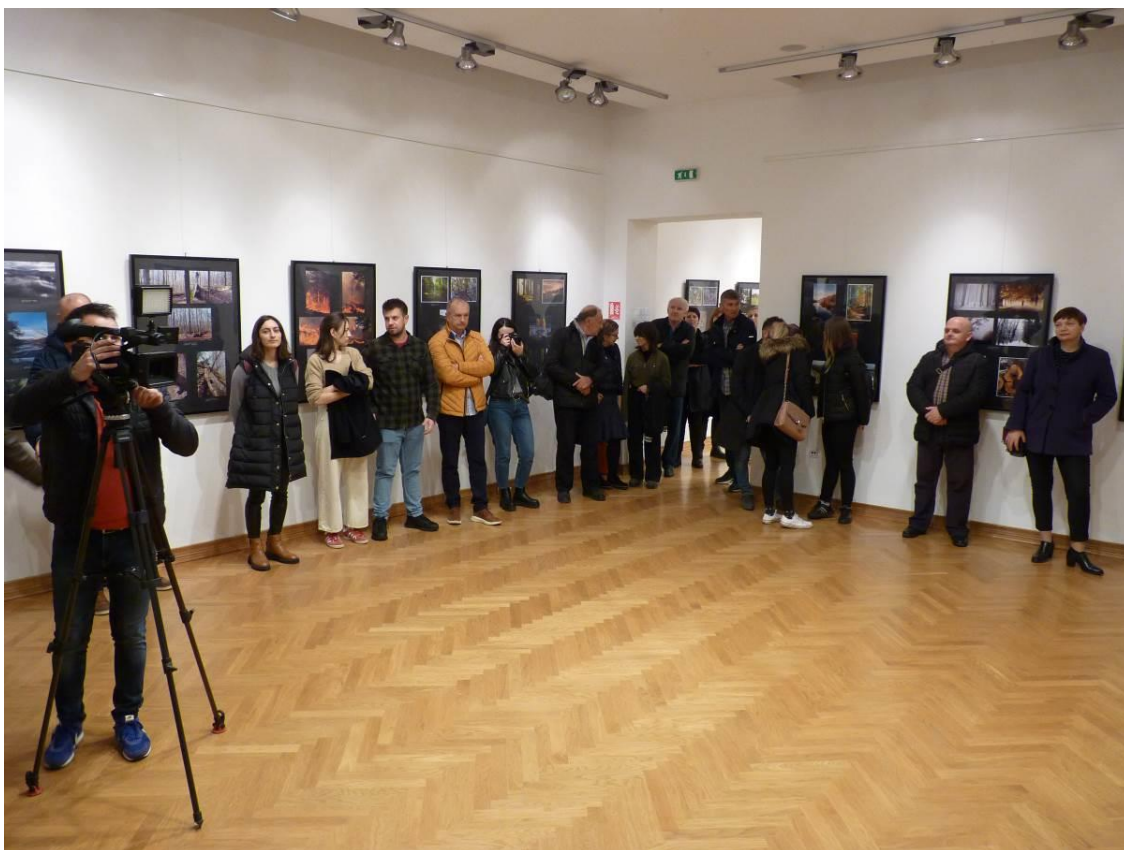
19. Otvaranje izložbe „Šuma okom šumara“