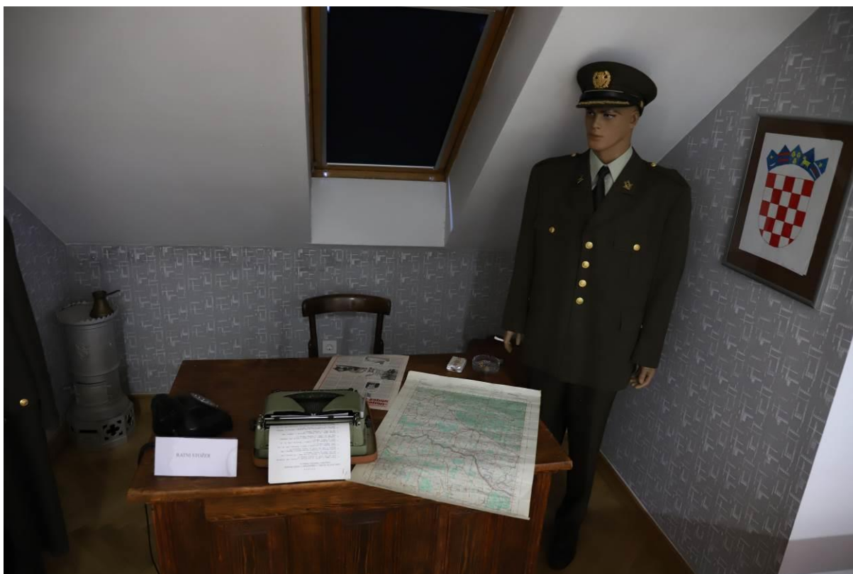
12. Izložba „Učitelju, zašto se to dogodilo?“