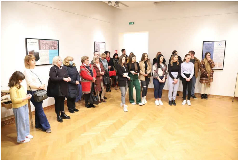
6. Otvaranje izložbe „Slatinčanke“