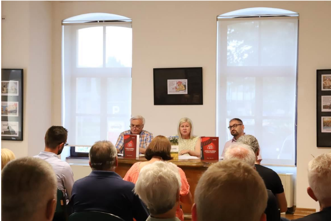
5. Predstavljanje knjige Ličani u Slavoniji u prošlosti i sadašnjosti i Ličani i/ili Slavonci