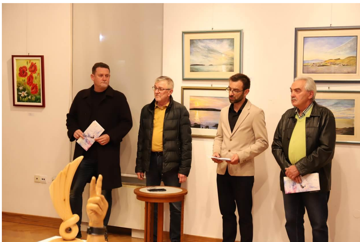
20. Otvaranje Godišnja izložba SLIK Slatina