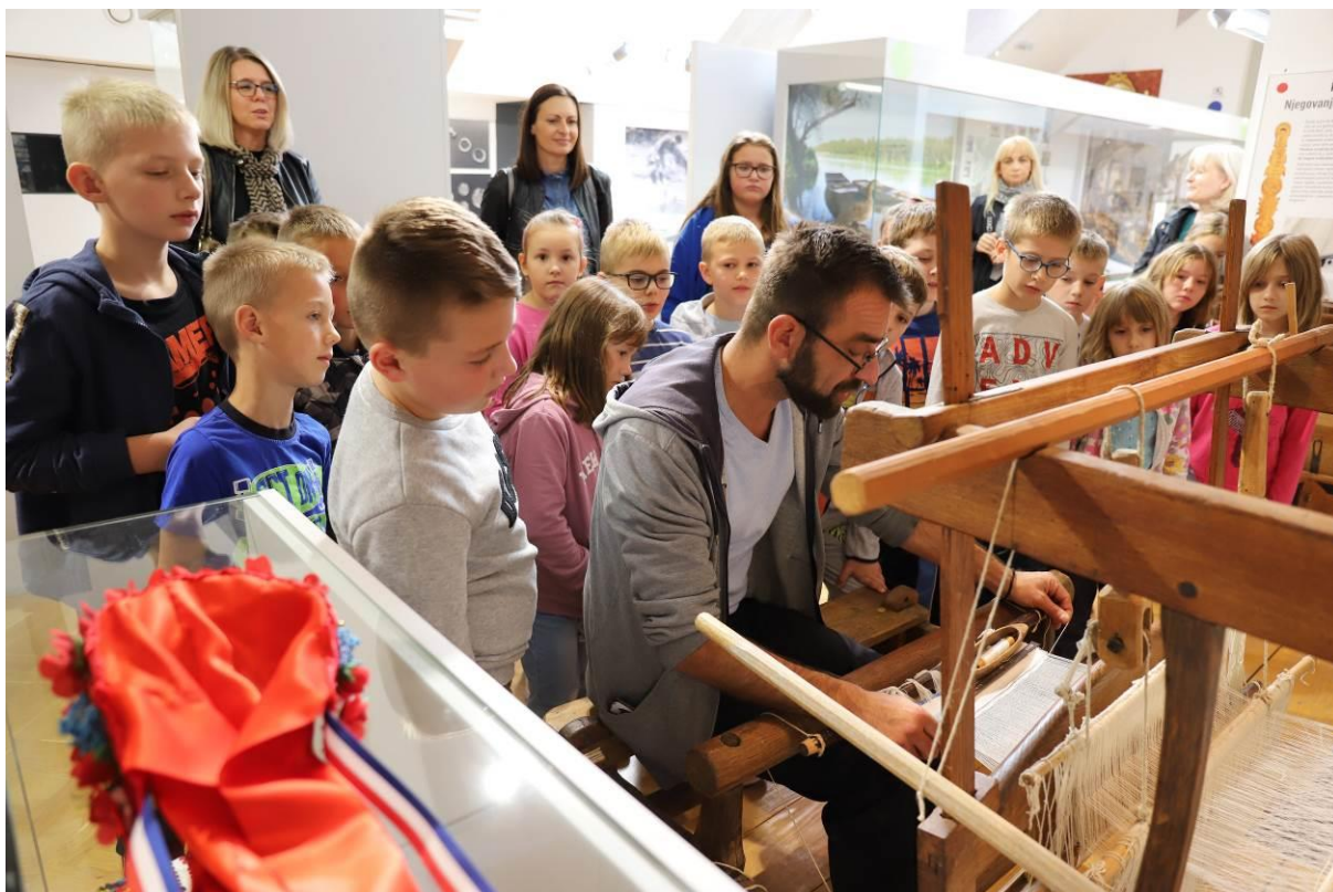
7. Posjet učenika Stalnom postavu