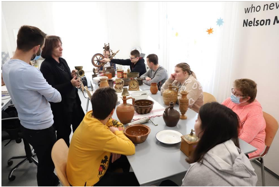
3. Posjet i predavanje udruzi Vretenac Slatina