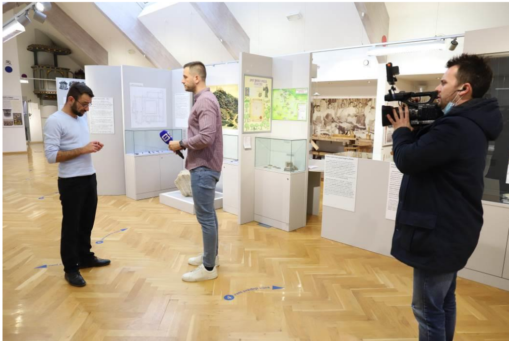
4. Izjava za Plavu TV