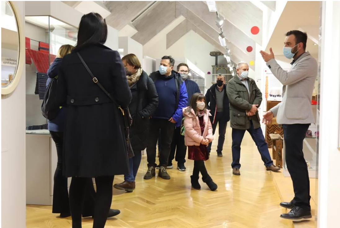
1. Noć muzeja