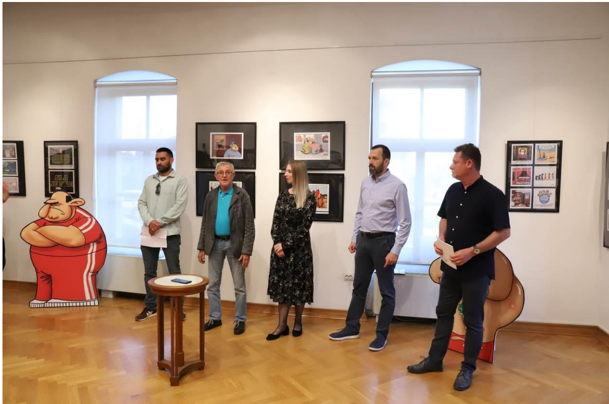
9. Nik Titanik „Kronika hrvatske gluposti“