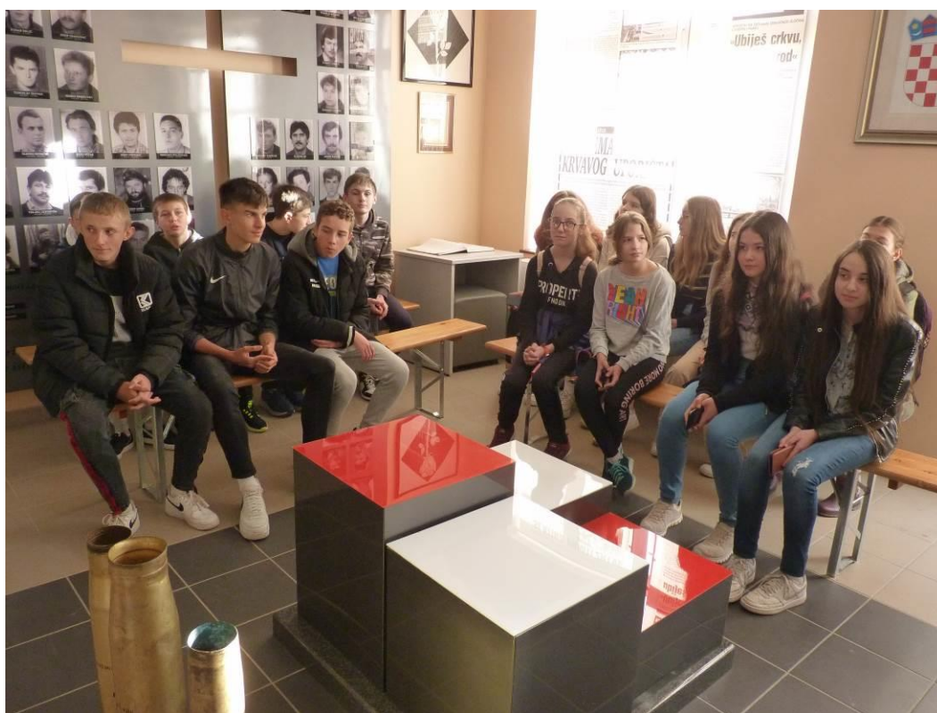
18. Spomen soba Domovinskog rata – dokumentarni film Slatinski kraj u Domovinskom ratu