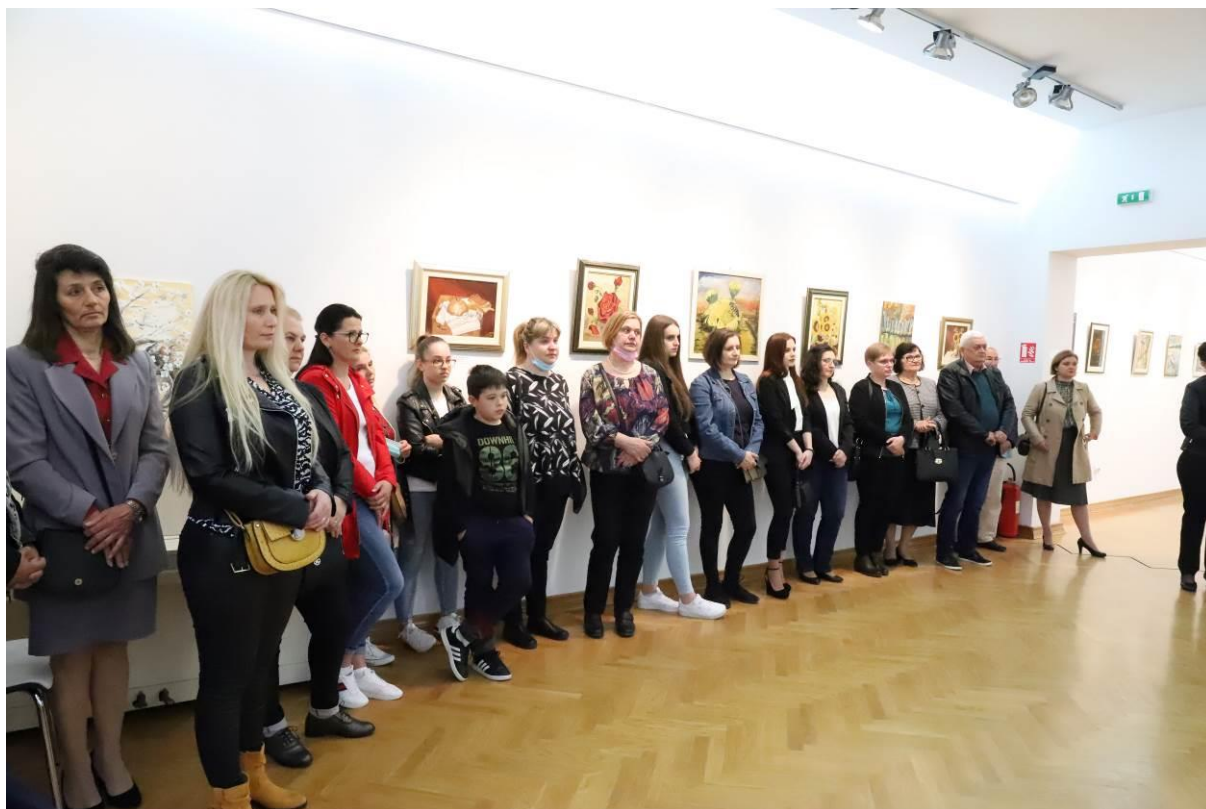
8. Otvaranje izložbe Zavičajna sjeta