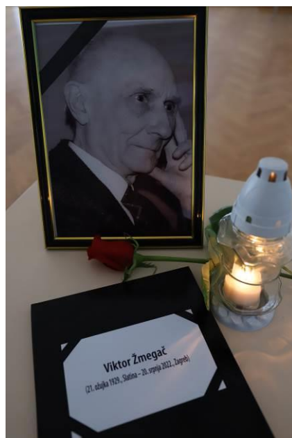
13. Komemoracija Viktoru Žmegaču